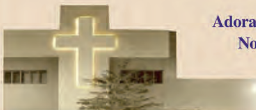
Jejuicki Ośrodek Milenijny

W pierwszy piątek miesiąca - od 17:30 do 19:30